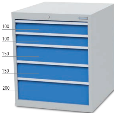
■ 5 x Schublade