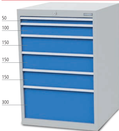
■ 6 x Schublade

Schubladenschränke Tiefe 736 | 705 x 736 x 1019 mm (B x T x H) | R 24-24