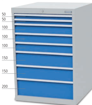
■ 8 x Schublade