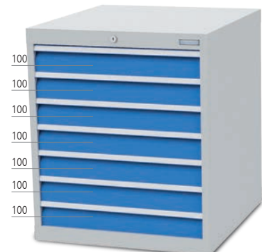
■ 7 x Schublade