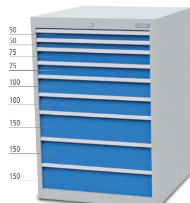
■ 9 x Schublade