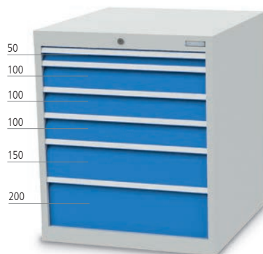
■ 6 x Schublade