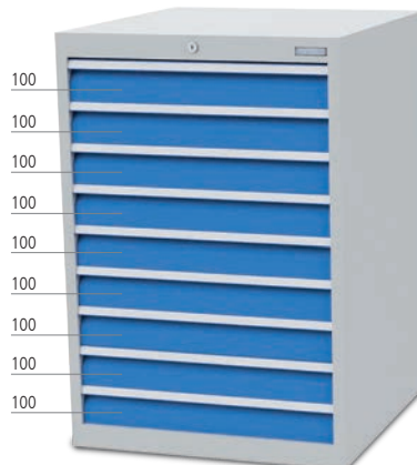
■ 9 x Schublade