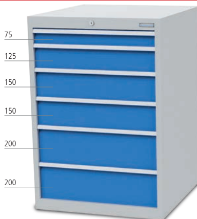
■ 6 x Schublade