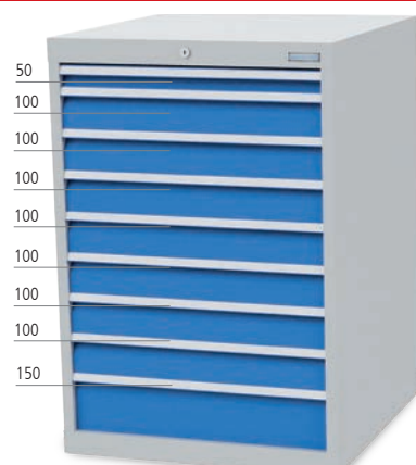
■ 9 x drawer